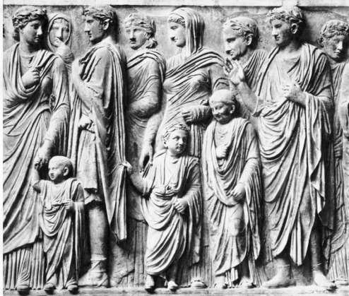
Idade Antiga Procissão Imperial, parte do friso da Ara Pacis. Mármore, alt. 1,60m.