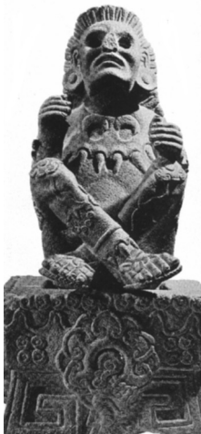
América Arte asteca. Estatueta de Xochipilli, deus das flores, da dança e do folguedo. Museu Nacional de Antropologia, México.